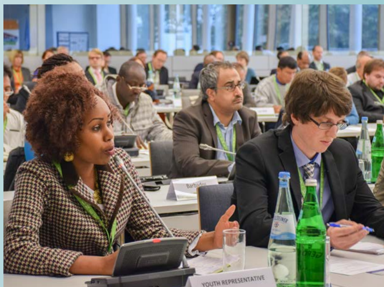
Foro Global "Competencias para el Trabajo y la Vida, post-2015"

En sesiones plenarias y grupos de trabajo paralelos durante las tres jornadas del Foro, los participantes presentaron prácticas prometedoras de escuelas, entidades y regiones enteras que