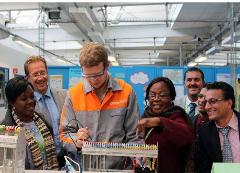
Visita de estudio durante el Foro Global

reorganizan su EFTP para responder con ella al desempleo juvenil y promover la economía sostenible. Los delegados a la Conferencia coincidieron en que es preciso intensificar la labor de documentar y compartir estas iniciativas.