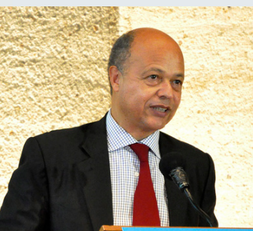
David Atchoarena

Seguimiento del Tercer Congreso Internacional UNESCO sobre la EFTP